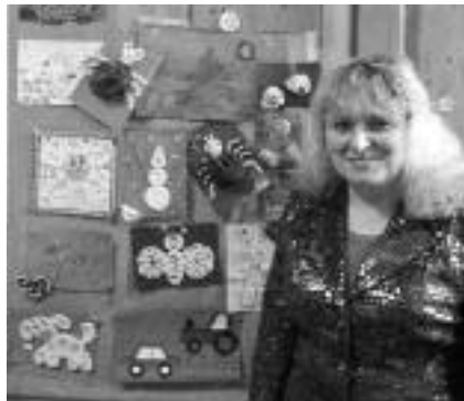
Это поделки, сделанные руками наших маленьких курсантов.