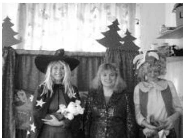
А в выходные дни взрослых и детей ждет сказка. Каждый раз разная. В нашем театре широкий репертуар.

Полезная детская сказка "Три поросенка".