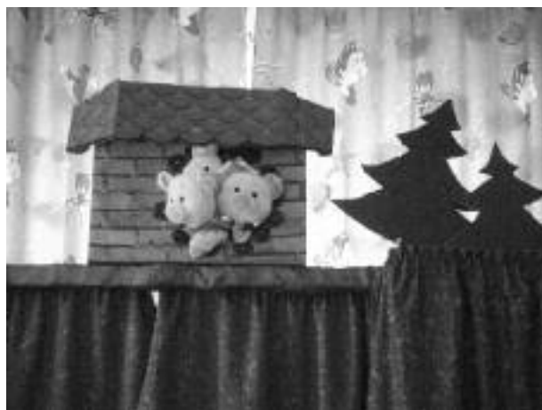
И как важно серьезно относиться к тому, что ты делаешь.

Дети понимают, как ненадежны непрочные вещи, построенные просто тяп-ляп, они могут привести даже к беде.